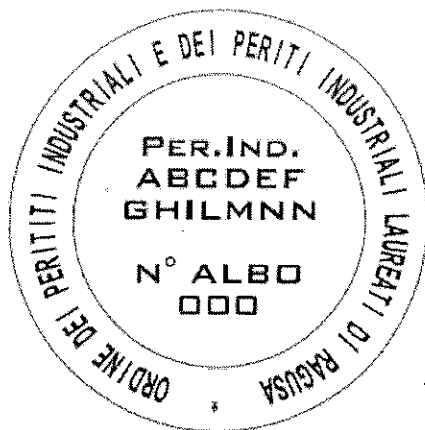
FAX SIMILE TIMBRO PROFESSIONALE